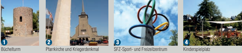
1 Büchelturn 2 Pfarrkirche und Kriegerdenkmal 3 SFZ-Sport- und Freizeitzentrum 4 Kinderspielplatz

The posters, which to date are located in different points. The choice of angles corresponds roughly to the viewers' present-day location.